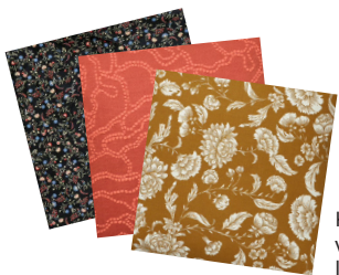
Kúsok vzorovanej látky