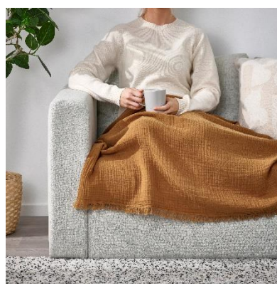
Selimut/alas VALLKRASSING RM59 HB: RM89