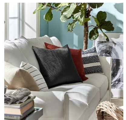
Sarung kusyen VIGDIS RM19.90 HB: RM29.90