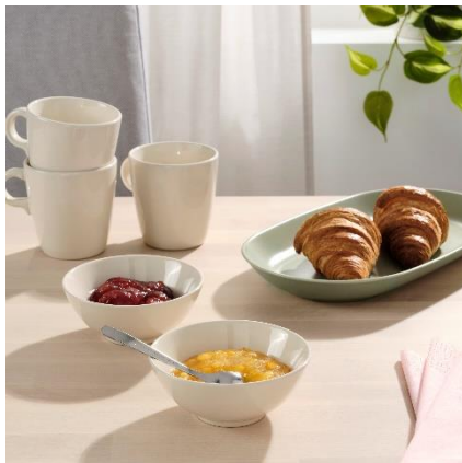
Mangkuk FÄRGKLAR RM15.90 / 4 unit HB: RM19.90 / 4 unit