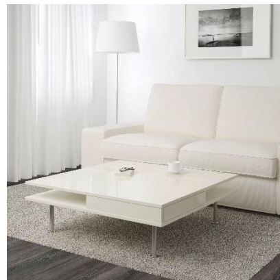
Meja kopi TOFTERYD RM799 HB: RM999