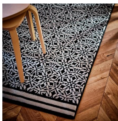
Ambal HEMBJUDEN RM599.00