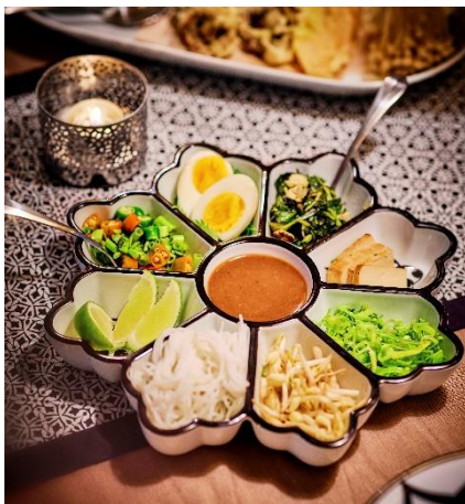
Bekas hidangan HEMBJUDEN RM99