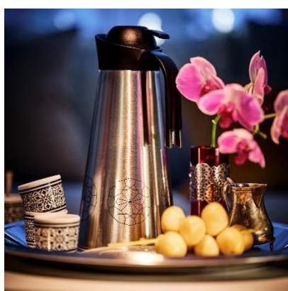
Kelalang vakum HEMBJUDEN RM99.00 Cawan/6 unit HEMBJUDEN RM49.90