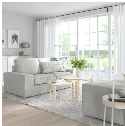
Sofa dua tempat duduk KIVIK, kelabu muda Orrsta RM1,295 HB: RM1,395