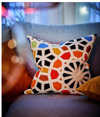
Sarung kusyen HEMBJUDEN RM19.90

Bagi menyemarakkan lagi sambutan Aidilfitri yang bakal menjelang tiba, secara tradisinya rumah kita akan diberikan wajah baru. Tidak kiralah ruang berkonsepkan tradisional atau minimalis moden, IKEA ada sesuatu yang istimewa untuk semua dengan koleksi edisi terhad HEMBJUDEN, yang boleh didapati di semua gedung IKEA serta secara dalam talian ( *Sementara stok masih ada ). Kagumkan tetamu anda dan jadikan ia Raya yang sukar dilupakan!