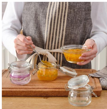
Balang berpenutup KORKEN RM15.90 / 3 unit HB: RM19.90 / 3 unit