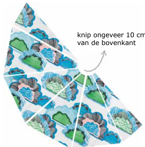
knip ongeveer 10 cm van de bovenkant

Je hebt nu 4 gelijke driehoeken en 2 halve driehoeken. Wanneer je de driehoeken aan elkaar gaat naaien, houdt dan een centimeter tussen stof en naad aan en zorg dat alle onafgewerkte randen naar boven uitsteken. De halve driehoeken stik je met de schuine kant vast aan de rest.