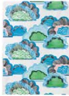
2,5 m stof (minimum 1,5 m breed)