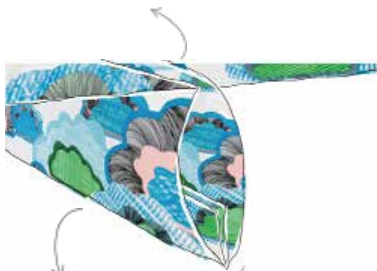
tunnel van 140 cm lang en 5 cm breed