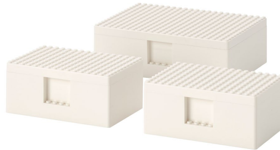
BYGGLEK 뷔글레크 수납함+뚜껑3종 ₩14,900 구성품: 수납함 1개(W175xD127, H59mm), 수납함 2개(W127xD88, H59mm). 화이트 804.534.03