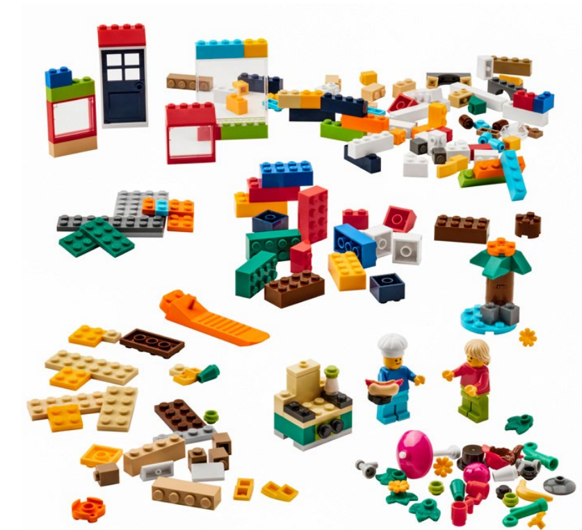
BYGGLEK 뷔글레크 201피스 레고 블록 세트 ₩21,900 구성품: 다양한 색상, 모양, 크기의 200개 레고 블록과 1개의 실용적인 도구가 포함되어 있습니다. 혼합 색상 004.368.89