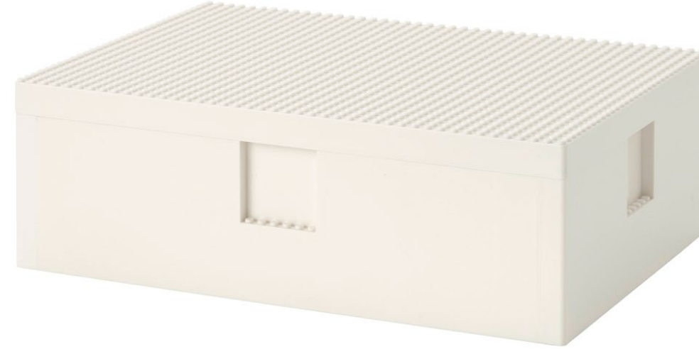
BYGGLEK 뷔글레크 수납함+뚜껑 ₩21,900 L35xW26, H12cm. 화이트 904.534.07

IKEA 매장에서만 판매되는 BYGGLEK 뷔글레크 레고 블록 세트도 만나보세요!