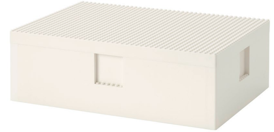
BYGGLEK 뷔글레크 수납함+뚜껑 ₩19,900 L26xW18, H12cm. 화이트 304.534.05