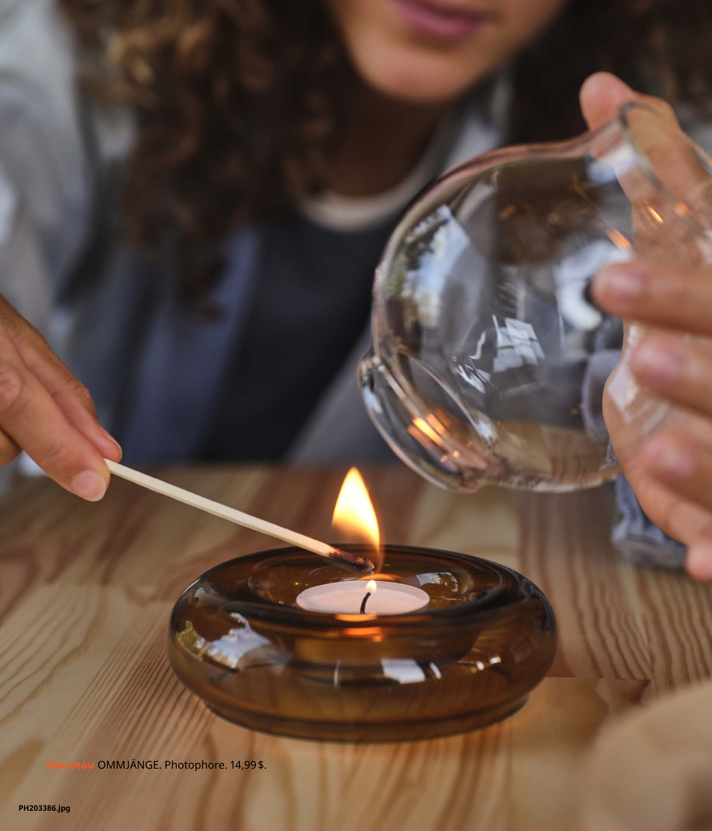
Nouveau OMMJÄNGE. Photophore. 14,99$.