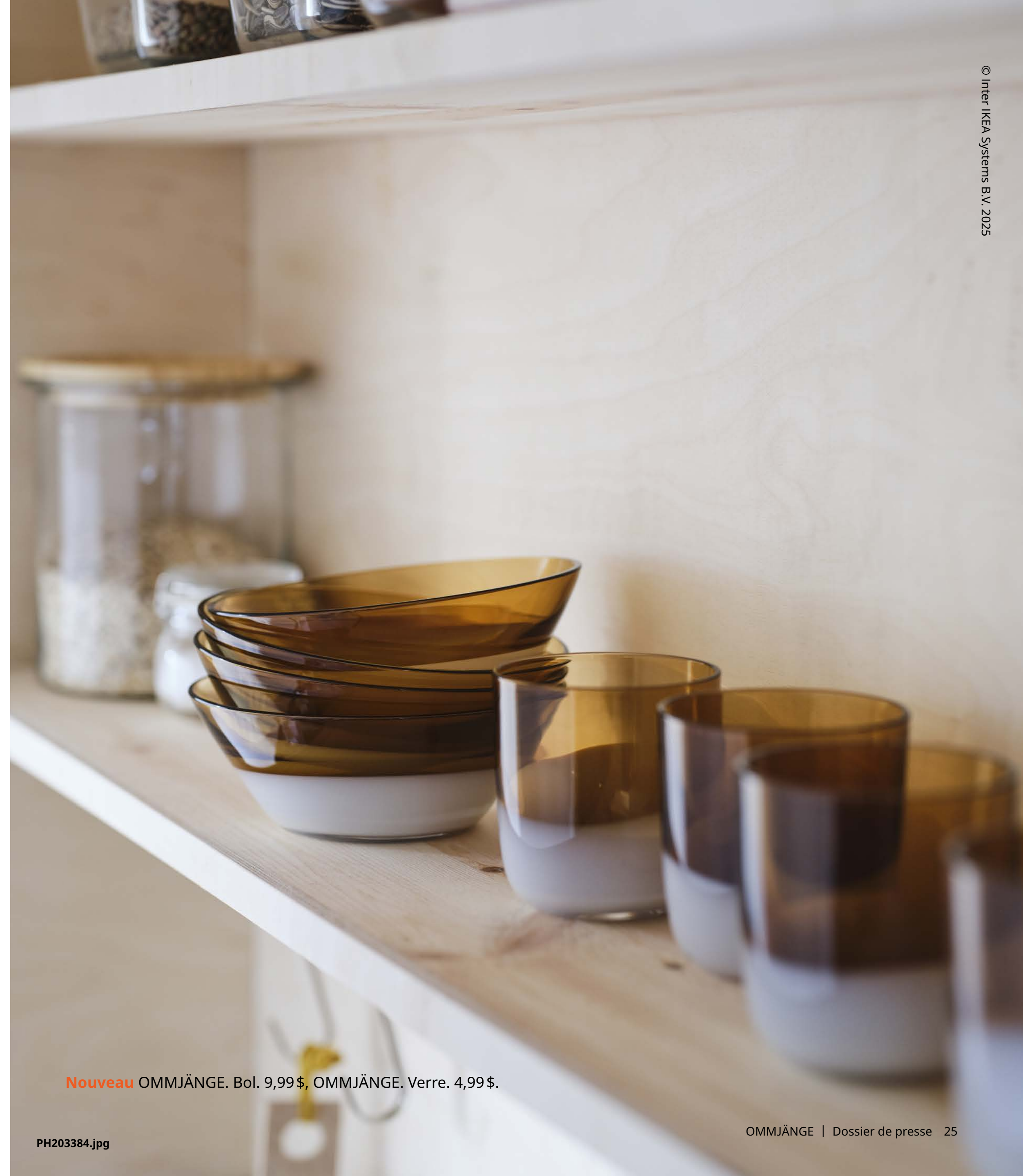
Nouveau OMMJÄNGE. Bol. 9,99$, OMMJÄNGE. Verre. 4,99$.