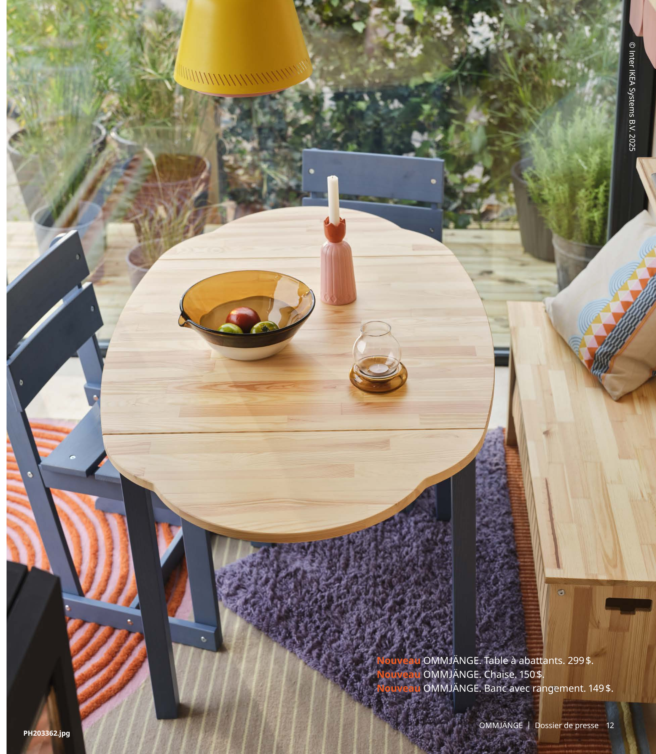
Nouveau OMMJÄNGE. Table à abattants. 299$. Nouveau OMMJÄNGE. Chaise. 150$. Nouveau OMMJÄNGE. Banc avec rangement. 149$.