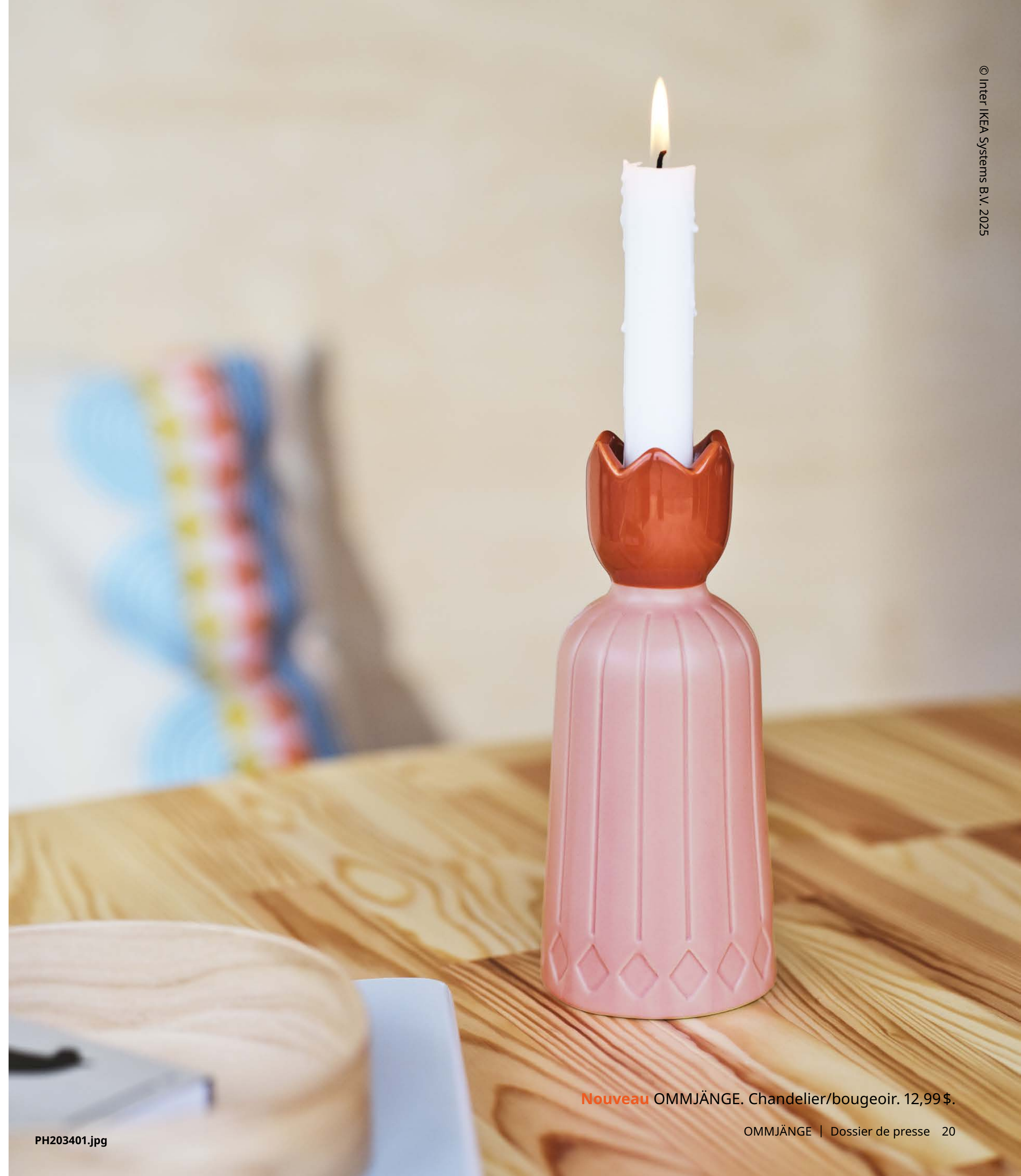
Nouveau OMMJÄNGE. Chandelier/bougeoir. 12,99 $.