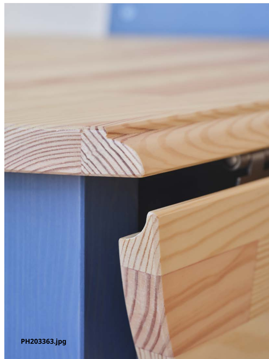
Nouveau OMMJÄNGE. Table à abattants. 299 $. Nouveau OMMJÄNGE. Chaise. 150 $.

La table pliante traditionnelle a été créée pour les petits espaces et jouissait d'une grande popularité il y a deux siècles. La table à abattants OMMJÄNGE offre sa propre version de la table souvent ornée à travers les âges, mais cette fois, c'est le plateau lui-même qui fait office de décoration.