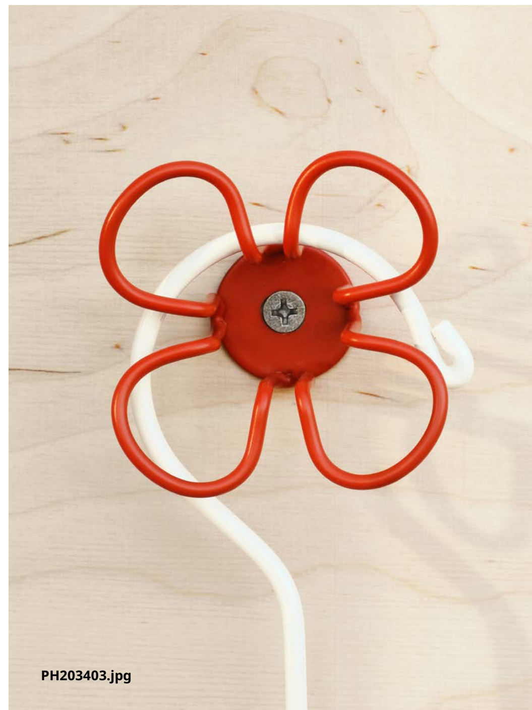
Nouveau OMMJÄNGE. Crochet mural. 5,99 $/paquet de 3.

Les crochets muraux OMMJÄNGE sont inspirés de la méthode traditionnelle de torsion du fil métallique. Avec leurs couleurs joyeuses et leur forme de trèfle, ils sont vendus par ensemble de trois. Ces petites fleurs murales audacieuses peuvent transformer tout coin inutilisé en rangement fonctionnel.