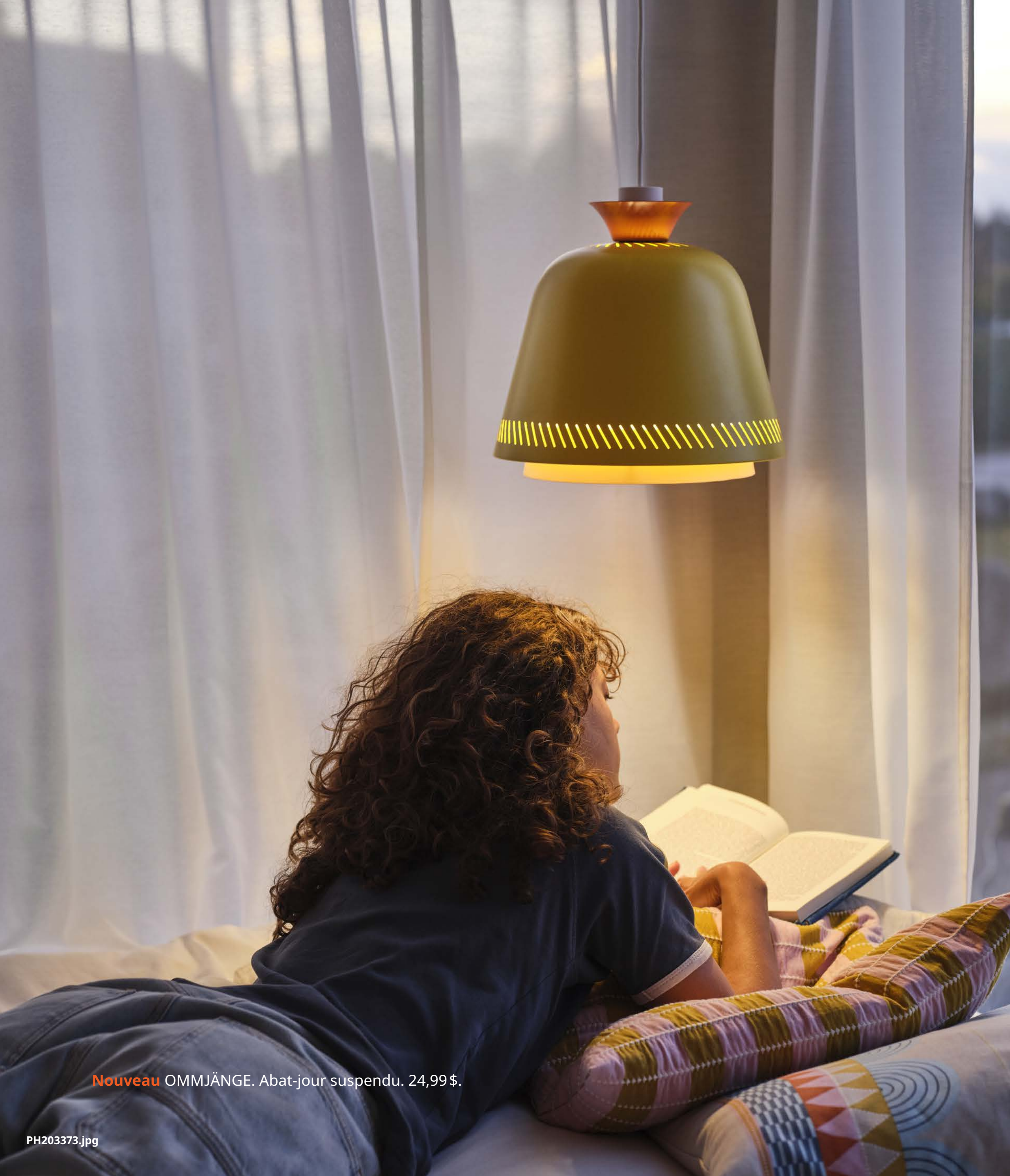
Nouveau OMMJÄNGE. Abat-jour suspendu. 24,99 $.