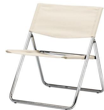
PE942185.jpg NEU MOFALLA Sessel W58xD57, H42cm €79,99 805.550.91