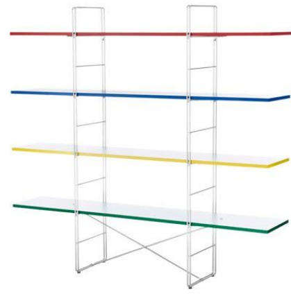
PE957804.jpg NEU BYAKORRE Regalelement W170xD32, H157cm. €149,- 205.864.58

Diese Neuheiten sind ab 1. Februar 2025 in den IKEA Einrichtungshäuser in Österreich und online erhältlich. Alle Angaben ohne Gewähr.