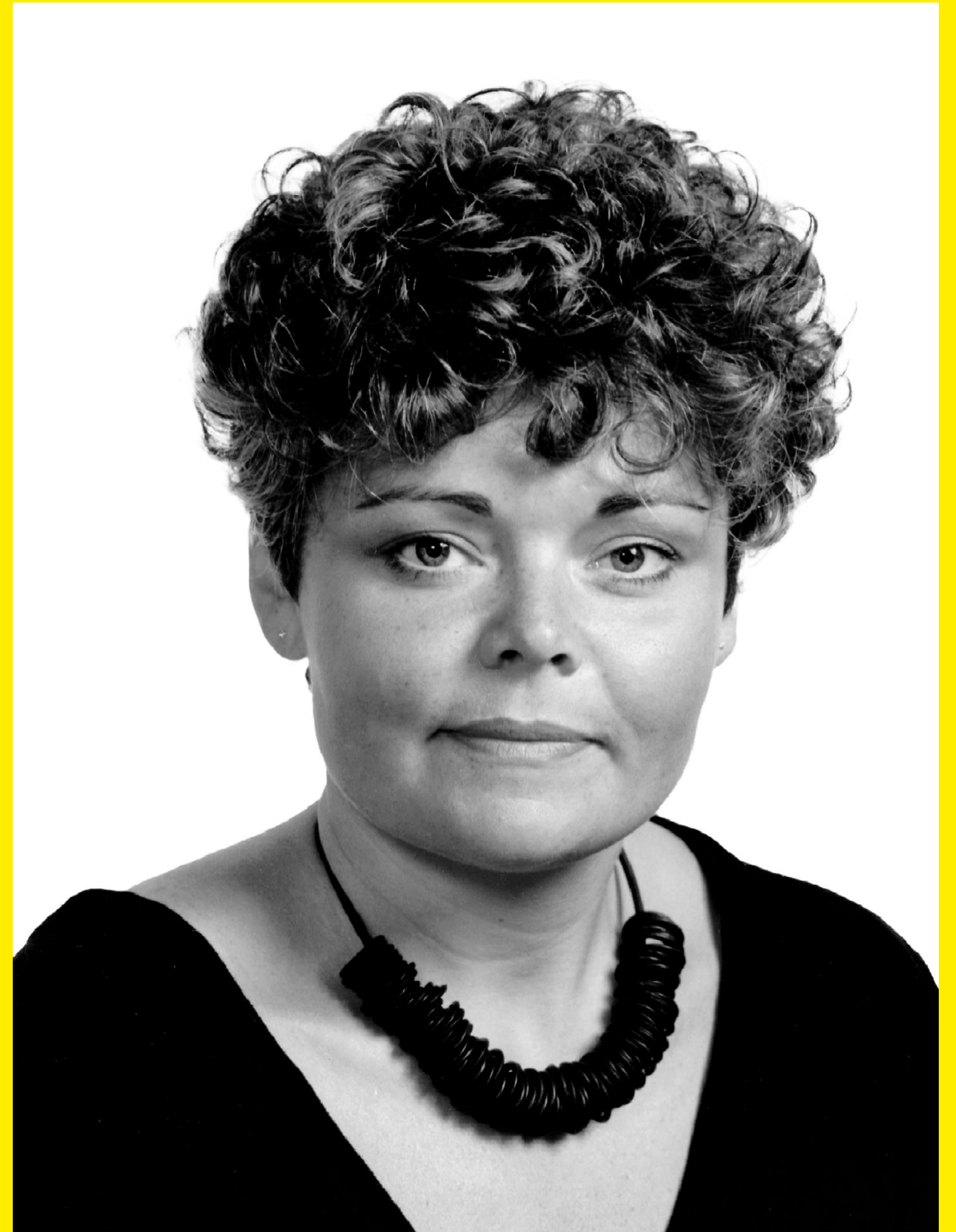
Unten: KÄLLARHALS Vasen 2025