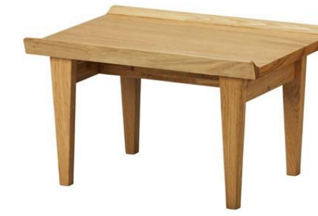
PE958056.jpg NEU GUTTANE Beistelltisch W39xL58, H32cm €99,- 805.877.18