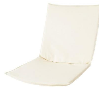
PE957889.jpg NEU SKÅLBODA Polster für Sessel L96xW48cm €20,- 705.567.79