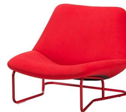
PE942197.jpg NEU SOTENÄS Sessel W86xD81, H68cm €229,- 105.819.13