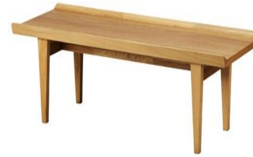
PE958055.jpg NEU GUTTANE Couchtisch W39xL116, H32cm €179,- 105.877.12