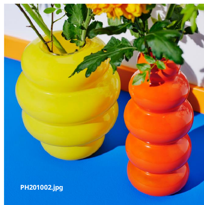
Oben: SNURRA Vasen 1996