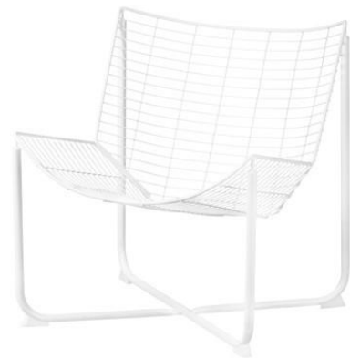
PE942188.jpg NEU SKÅLBODA Sessel W64xD69, H71cm €79,99 205.820.35