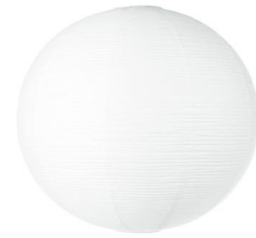
PE957826.jpg NEU GULLSUDARE Hängeleuchenschirm Ø70cm. €9,99 805.836.16