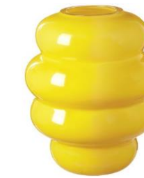
PE940027.jpg NEU KÄLLARHALS Vase Ø19, H22cm €14,99 705.837.11