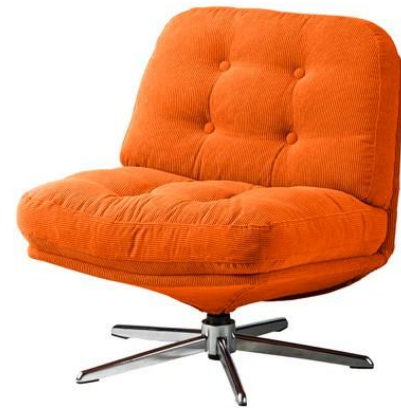
PE942192.jpg NEU DYVLINGE Drehsessel W63xD75, H68cm €199,- 005.819.18