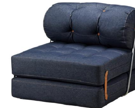
PE957819.jpg NEU VÅRKUMLA Bettssessel W91xD90, H81cm €249,- 805.877.04