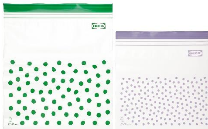
TABBERAS wiederverschließbarer Beutel