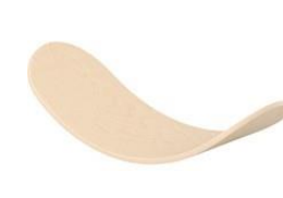
PE998044.JPG NEU GREJSIMOJS balance board for children €000 Clear acrylic lacquered wood veneer and birch veneer. W28xL73, H18cm. Wood 505.989.64