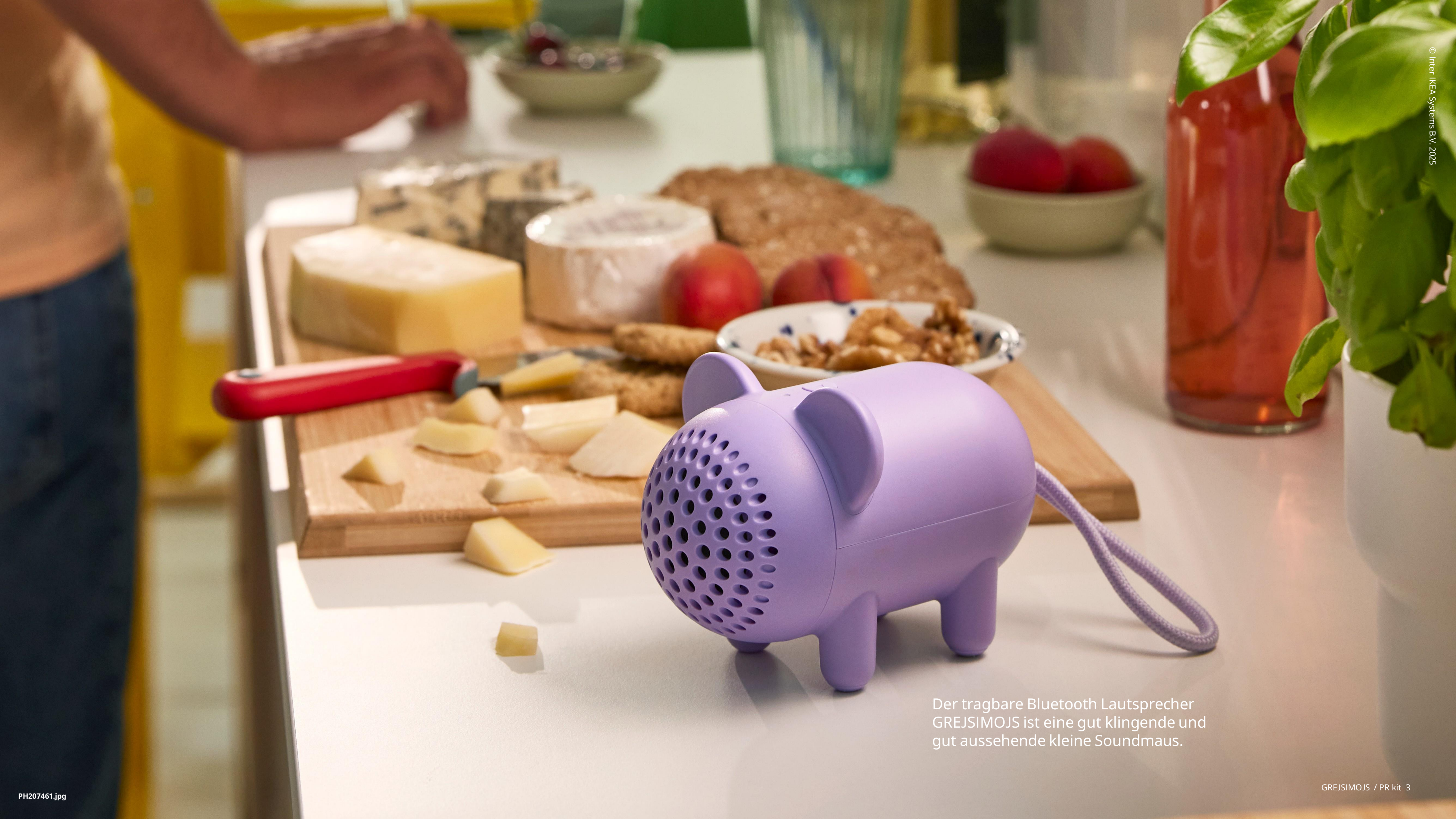
Der tragbare Bluetooth Lautsprecher GREJSIMOJS ist eine gut klingende und gut aussehende kleine Soundmaus.