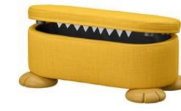
PE991233.JPG NEU GREJSIMOJS pouffe with storage €000 100% polypropylene, plywood and paperboard. Fabric: 100% polyester. W57xD32, H24cm. Yellow 106.031.80