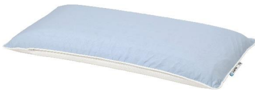
ergonomisches Kissen KVARNVEN