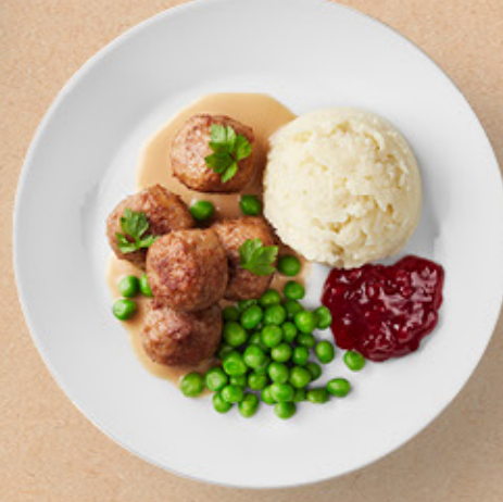
كرات لحم (٥ قطع) Meatballs (5pcs) Calories 345