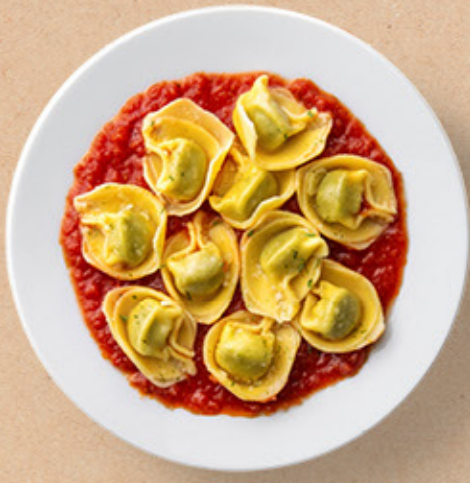
تورتليني بالجينة Cheese Tortellini Calories 499