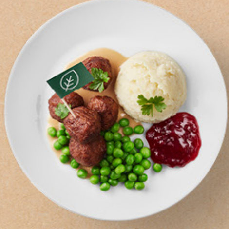
كرات نباتية (٥ قطع) Plant balls (5pcs) Calories 425