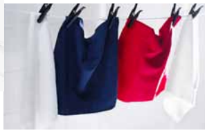
LÖDDER, viacúčelová utierka z mikrovlákna. € 2,49/4 ks (Jednotková cena € 0,63)

Chytré utierky z mikrovlákien absorbujú 7-krát väčšie množstvo vody, ako je ich hmotnosť. Utierky na čistenie z mikrovlákien dokážu vsiaknuť tuk, a preto nemusíte používať žiadne chemikálie alebo minimum čistiacich prostriedkov. Nepúšťajú vlákna. Dajú sa prať a opätovne používať. Uprednostnite ich pred jednorazovými papierovými utierkami.