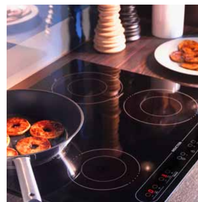
NUTID HIN4T, indukčná varná doska. €329

Indukčné varné dosky sú oveľa rýchlejšie a efektívnejšie ako elektrické alebo sklo-keramické. Zohrievajú iba hrniec, samotná varná doska zostáva chladná. Výsledkom je minimálny únik tepla. Ak použijete hrniec/panvicu správnej veľkosti a pokrievku, docielite ešte menšiu stratu tepla.