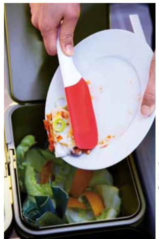
ENVIS, stierka, €4,99/2 ks

Neplýtvajte vodou oplachovaním riadu predtým, ako ho vložíte do umývačky! Namiesto toho odstráňte zvyšky jedla pomocou kuchynského náčinia.