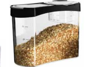
RARITET, dóza s vrchnákom € 3,99 Varením primeraného množstva jedla sa vyhnete zbytočnému odpadu. Nádobu RARITET má vo veku odmerku, ktorá vám pomôže odmerať množstvo potravín pri varení.

UTZ = v jazyku Mayov znamená „dobré“ V IKEA predávame a podávame výlučne kávu s certifikátom UTZ. Udeľuje ho nezávislá, nezisková organizácia, ktorá zavádza sociálne a environmentálne štandardy v oblasti pestovania kávy a jej distribúcie. Pítie kávy produkovanej zodpovedným spôsobom vám dá istotu, že bola vyrobená férovo a pomohla prispieť ku zvýšeniu kvality života plantážnikov.