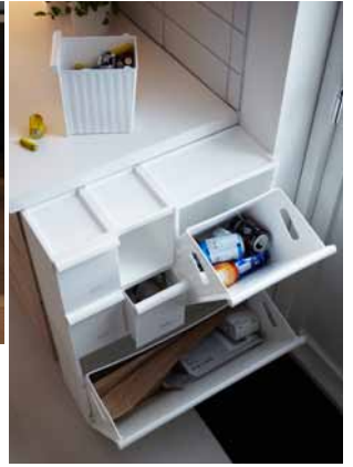
RETUR, séria košov na triedenie odpadu.

Jedným zo spôsobov, ako produkovať menej odpadu, je nepoužívať jednocélové predmety.