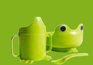
MATA, servis. €2,49/4 ks

ŠETRENIE ZDROJOV JE SÚČASŤOU PRÍSTUPU KEĎ V RÁMCI PRÓDUKTOVÉHO VÝVOJA. Nielenže to šetrí peniaze, ale aj životné prostredie. Dizajnéri a návrhári pracujú na nových technikách, aby sa z každého materiálu dalo vyťažiť čo najviac.