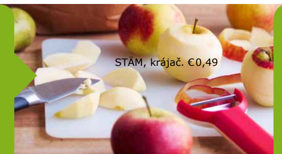
STÄM, krájač. € 0,49