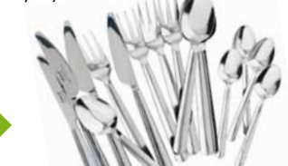
BONUS, set príborov. € 2,99/16 ks

Bežné plastové igelitky vám poslúžia len chvíľu, ale ich rozklad potrvá stovky rokov. Zvyčajne nevydržia dlho a nie sú veľmi vzhľadné. Uprednostnite radšej tašky vyrobené z pevných a odolných materiálov, ktoré budete môcť používať roky, znova a znova.