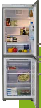
NUTID FCF 191/100, chladnička s mrazničkou a funkciou „No frost“. €649

Energia Znižovanie emisií CO 2 v spojitosti so spotrebou energie v domácnosti prispieva k boju proti klimatickým zmenám. Výber správnych spotrebičov a ich optimálne využitie patria k dôležitým krokom. Nezabúdajte, že staré spotrebiče by mali byť odovzdané na recykláciu a spracované ekologickým spôsobom.