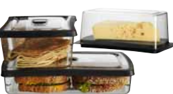
RARITET, séria dóz na potraviny.

Vlhkosť v chladničke znížite, ak budete potraviny skladovať v zatvorených dózach, miskách alebo vreckách. Znížite tak spotrebu elektriny a potraviny zostanú dlhšie čerstvé.