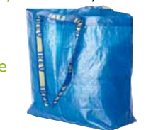
FRAKTA, nákupná taška. € 0,59

Bežné plastové igelitky vám poslúžia len chvíľu, ale ich rozklad potrvá stovky rokov. Zvyčajne nevydržia dlho a nie sú veľmi vzhľadné. Uprednostnite radšej tašky vyrobené z pevných a odolných materiálov, ktoré budete môcť používať roky, znova a znova.