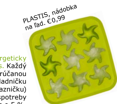
PLASTIS, nádobka na ľad. €0,99

Inteligentný dizajn s ohľadom na životné prostredie. Vďaka dizajnu tejto chladničky neuniká pri jej otvorení toľko chladného vzduchu, aby muselo dôjsť k opätovnému chladeniu. Všetky chladničky IKEA patria do energetickej triedy A+. Automatická kontrola vlhkosti vzduchu chráni pred tvorbou námrazy – chladnička nezvyšuje spotrebu energie.