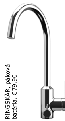
RINGSKÄR, páková batéria. €79,90

Voda z kohútika sa dá prenášať aj bez plastových nákladiakov. Pitie vody z vodovodu napomáha zníženiu emisií CO 2 a šetrí prírodné zdroje potrebné na výrobu skla a plastov. Navyše šetrí vašu peňaženku!