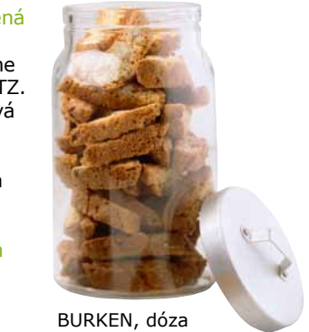
BURKEN, dóza s vrchnákom. € 2,49