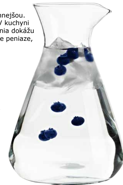
LEENDE, karafa. €4,49

Štúdia Univerzity v Bonne v Nemecku ukázala, že používaním umývačiek riadu IKEA možno znížiť spotrebu vody o 85 % a spotrebu energie o 58 %. Naše umývačky prispievajú k zníženiu emisií CO 2 o 150 kg ročne.