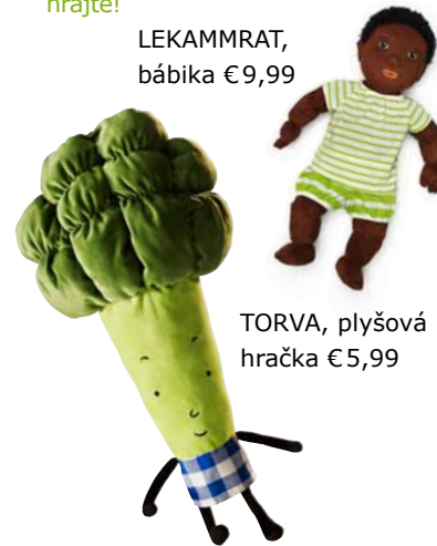
LEKAMMRAT, bábika €9,99

Séria hračiek MULA, to je masívne drevo, bezpečné farby a dlhotrvajúca kvalita, pretože je vyrobená zo 100 % obnoviteľných a recyklovateľných zdrojov. Farby a laky neobsahujú žiadne škodliviny, takže neuškodí ani vášmu dieťaťu, ani rastlinám v miestnosti. Séria MULA je vhodná pre všetky generácie. No tak sa hrajte!