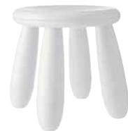
MAMMUT, stolička €4,99