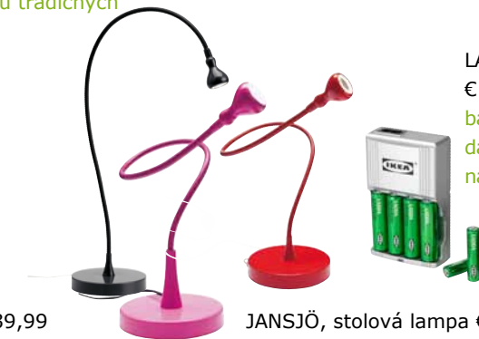
JANSJÖ, stolová lampa €9,99/ks Technológia LED. Rameno sa dá nastaviť podľa potreby osvetlenia.