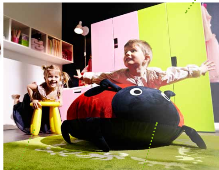
Nábytok MAMMUT Plastový, trvácny a ľahko sa udržiava.