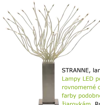
STRANNE, lampa €39,99 Lampy LED poskytujú rovnomerné osvetlenie farby podobnej klasickým žiarovkám. Rozsvieti sa okamžite a nezhrieva sa. Neobsahuje ortuť.

Vezmite si napríklad naše LED lampy a žiarovky. LED je v podstate dióda emitujúca svetlo a v oblasti osvetlenia predstavuje skutočnú revolúciu, pretože nielen že šetrí energiu, ale lampy majú aj oveľa dlhšiu životnosť – 25 000 hodín (približne 25 rokov). Spotreba energie je o 80 % nižšia než u tradičných žiaroviek.