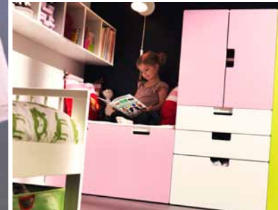
Séria detského nábytku STUVA je vyrobená z voštinovej dosky, flexibilná, pretože rastie spolu s deťmi, svetlá a trvácna.