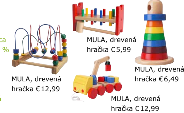
MULA, drevená hračka €12,99