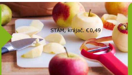
STÄM, krájač. €0,49

UTZ = v jazyku Mayov znamená „dobré“ V IKEA predávame a podávame výlučne kávu s certifikátom UTZ. Udeľuje ho nezávislá, nezisková organizácia, ktorá zavádza sociálne a environmentálne štandardy v oblasti pestovania kávy a jej distribúcie. Pítie kávy produkovanej zodpovedným spôsobom vám dá istotu, že bola vyrobená férovo a pomohla prispieť ku zvýšeniu kvality života plantážnikov.