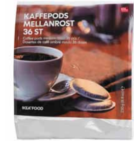
KAFFE PODS MELLANROST, kávové tablety. €2,80/36 ks (Jednotková cena € 0,08)