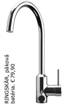
RINGSKÄR, páková batéria. €79,90

Voda z kohútika sa dá prenášať aj bez plastových nákladiakov. Pitie vody z vodovodu napomáha znižovaniu emisií CO 2 a šetrí prírodné zdroje potrebné na výrobu skla a plastov. Navyše šetrí vašu peňaženku!