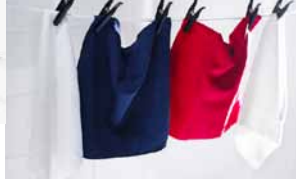
LÖDDER, viacúčelová utierka z mikrovlákna. €2,49/4 ks (Jednotková cena € 0,63)

Chytré utierky z mikrovlákien absorbujú 7-krát väčšie množstvo vody, ako je ich hmotnosť. Utierky na čistenie z mikrovlákien dokážu vsiaknuť tuk, a preto nemusíte používať žiadne chemikálie alebo minimum čistiacich prostriedkov. Nepúšťajú vlákna. Dajú sa prať a opätovne používať. Uprednostnite ich pred jednorazovými papierovými utierkami.