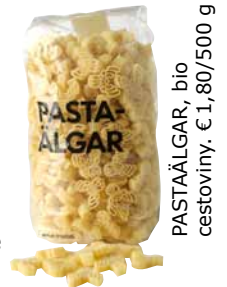
PASTAÄLGAR, bio cestoviny. € 1,80/500 g

Ak kupujete bio potraviny, máte istotu, že boli vyrobené bez pesticídov alebo umelých hnojív. Bio produkty sa prepravujú na krátke vzdialenosti: ovocie a zelenina sú čerstvejšie a pestujú sa až do úplného dozretia. Je to dobré pre vás i životné prostredie.