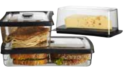
RARITET, séria dóz na potraviny.

Chladenie je energeticky náročný proces. Každý stupeň pod odporúčanou teplotou (5°C pre chladničku a -18°C pre mrazničku) spôsobuje nárast spotreby energie o 5 %.