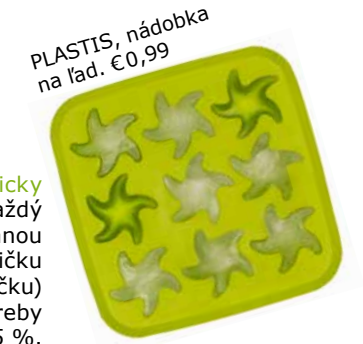
PLASTIS, nádobka na ľad. €0,99

Inteligentný dizajn s ohľadom na životné prostredie. Vďaka dizajnu tejto chladničky neuniká pri jej otvorení tolko chladného vzduchu, aby muselo dôjsť k opätovnému chladeniu. Všetky chladničky IKEA patria do energetickej triedy A+. Automatická kontrola vlhkosti vzduchu chráni pred tvorbou námrazy – chladnička nezvyšuje spotrebu energie.