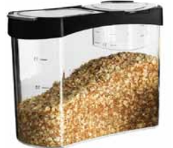
RARITET, dóza s vrchnákom. € 3,99 Varením primeraného množstva jedla sa vyhnete zbytočnému odpadu. Nádobu RARITET má vo veku odmerku, ktorá vám pomôže odmerať množstvo potravín pri varení.