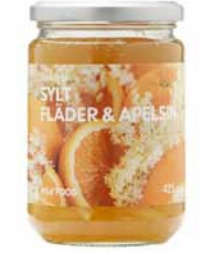
SYLT FLÄDER & APELSIN, bazový a pomarančový džem. € 2,90/450 g

VEDELI STE, ŽE? Ovocie prepravované leteckou dopravou mimo sezóny znamená 10 až 20-krát vyššiu spotrebu ropy ako pri rovnakom produkte počas sezóny. Znamená to aj viac skleníkových plynov. Doprajte si sezónne ovocie. Je lacnejšie a chutnejšie. S ohľadom na sezónnosť znížite negatívny dopad na životné prostredie.