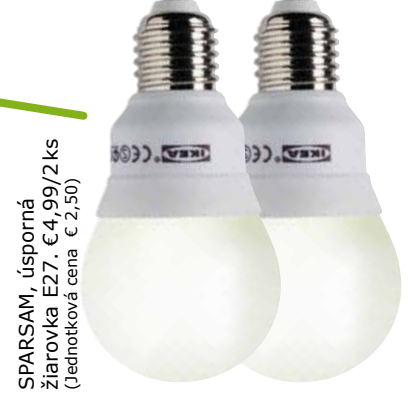
SPARSAM, úsporná žiarovka E27. €4,99/2ks (jednotková cena €2,50)

Úsporné žiarovky majú dve výhody: ich životnosť je 8 až 10-krát dlhšia ako pri klasických žiarovkách, tým sa znižuje aj množstvo odpadu. Navyše spotrebujú o 80 % menej energie. Úžasný spôsob, ako UŠETRIŤ AJ PENIAŽE! Žiarovky SPARSAM dokonca obsahujú menej ortuťe ako je predpísaná hranica, namiesto 5 mg len 3 mg.