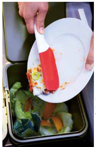
ENVIS, stierka, €4,99/2 ks

Nepletajte vodou oplachovaním riadu predtým, ako ho vložíte do umývačky! Namiesto toho odstráňte zvyšky jedla pomocou kuchynského náčinia.