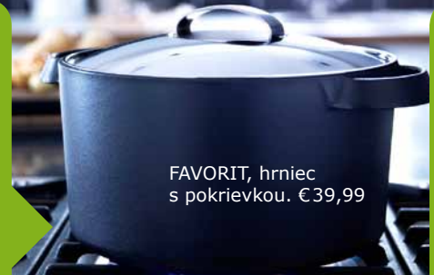
FAVORIT, hrniec s pokrievkou. €39,99

VEDELI STE, ŽE? Pokrievka zabraňuje úniku tepla, používajte ju preto pri zohrievaní vody i varení. Ušetríte tak až 20 – 30 % energie a večeru budete môcť podávať skôr.