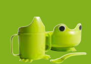
MATA, servis. €2,49/4 ks

ŠETRENIE ZDROJOV JE SÚČASŤOU PRÍSTUPU IKEA V RÁMCI PRŮDUKTOVÉHO VÝVOJA. Nielenže to šetrí peniaze, ale aj životné prostredie. Dizajnéri a návrhári pracujú na nových technikách, aby sa z každého materiálu dalo vyťažiť čo najviac.