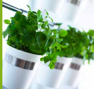
GRUNDTAL, stojan na príbor. € 4,99 Tu použitý ako kvetináč.

Nadmerná konzumácia mäsa predstavuje veľkú hrozbu pre životné prostredie, pretože chov si vyžaduje udržiavanie pasienkov, spôsobuje vyššie znečistenie pôdy a nadmerné využívanie poľnohospodárskej pôdy. Porozmýšľajte o tom a uvarte si vegetariánske jedlo párkrát do týždňa: mäso sa dá ľahko nahradiť zmesou obilnín a strukovín.