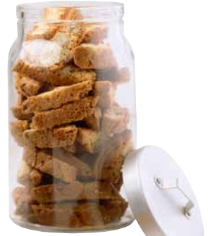
BURKEN, dóza s vrchnákom. € 2,49

UTZ = v jazyku Mayov znamená „dobré“ V IKEA predávame a podávame výlučne kávu s certifikátom UTZ. Udeľuje ho nezávislá, nezisková organizácia, ktorá zavádza sociálne a environmentálne štandardy v oblasti pestovania kávy a jej distribúcie. Pítie kávy produkovanej zodpovedným spôsobom vám dá istotu, že bola vyrobená férovo a pomohla prispieť ku zvýšeniu kvality života plantážnikov.