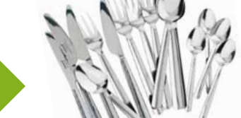
BONUS, set príborov. €2,99/16 ks

Bežné plastové igelitky vám poslúžia len chvíľu, ale ich rozklad potrvá stovky rokov. Zvyčajne nevydržia dlho a nie sú veľmi vzhľadné. Uprednostnite radšej tašky vyrobené z pevných a odolných materiálov, ktoré budete môcť používať roky, znova a znova.