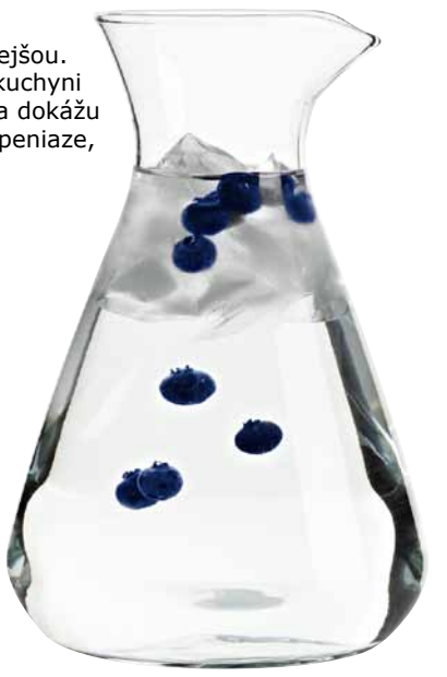
LEENDE, karafa. €4,49

Ak necháte vodu z vodovodu postáť v džbáne 10 – 15 minút, väčšina chlóru vyprchá a vy si budete môcť vychutnať jej lahodnú chuť.