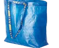
FRAKTA, nákupná taška. €0,59

Bežné plastové igelitky vám poslúžia len chvíľu, ale ich rozklad potrvá stovky rokov. Zvyčajne nevydržia dlho a nie sú veľmi vzhľadné. Uprednostnite radšej tašky vyrobené z pevných a odolných materiálov, ktoré budete môcť používať roky, znova a znova.