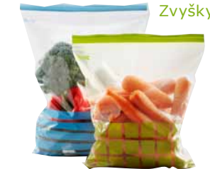
Zvyšky jedla sa dajú uskladniť aj v znovu použiteľných vreckách.