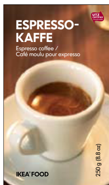
ESPRESSOKAFFE эспрессо 250г