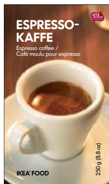
ESPRESSOKAFFE эспрессо 250г