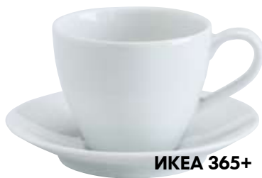
ИКЕА 365+ чашка кофейная с блюдцем