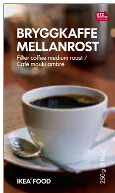
Молотый кофе средней обжарки 99.-/250г

У нас есть кофе на любой вкус, и у каждого сорта есть сертификат UTZ Certified.