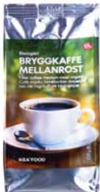
Молотый кофе средней обжарки, органический 149.-/250г