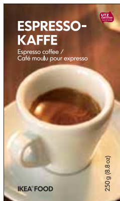
Кофе молотый эспрессо 109.-/250г