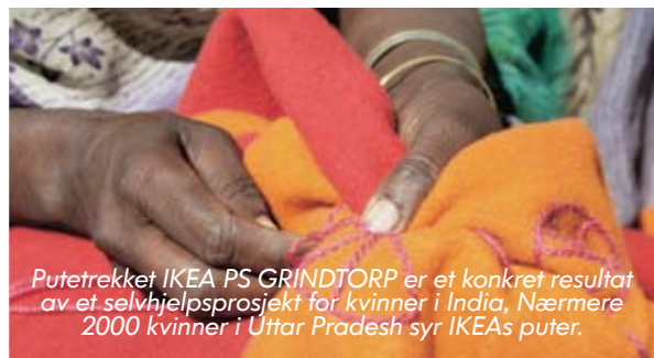
Putetrekket IKEA PS GRINDTORP er et konkret resultat av et selvhjelpsprosjekt for kvinner i India. Nærmere 2000 kvinner i Uttar Pradesh syr IKEAs puter.

Et annet viktig bidrag er opprettelsen av selvhjelpsgrupper for kvinner som ønsker å starte egen virksomhet. I India omfatter et av disse prosjektene 500 landsbyer og ca. 1,3 millioner innbyggere.