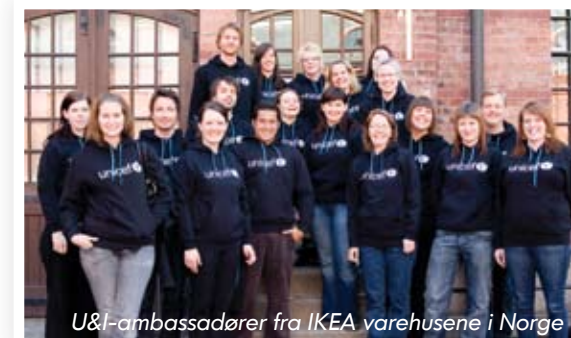
U&I-ambassadører fra IKEA varehusene i Norge