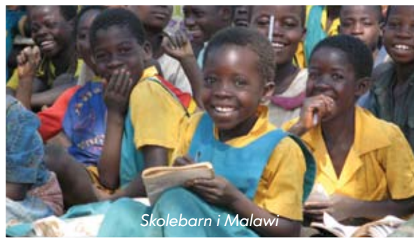
Skolebarn i Malawi

UNICEF og IKEA har vært internasjonale samarbeidspartnere siden 1994. Hovedfokus for samarbeidet har hele tiden vært å forebygge barnearbeid og å gi barn mulighet til å utvikle seg og gå på skole. UNICEF har fra starten rådet IKEA til å tenke langsiktig og se på helheten. Samarbeidet har utviklet seg til å omfatte en rekke forebyggende prosjekter i ulike verdensdeler.