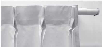
① フック仕様:ニッ山ヒダプリーツ