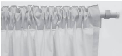
⑤ ポール仕様:ギャザープリーツ