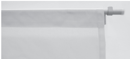
④ ポール仕様:ノンプリーツ