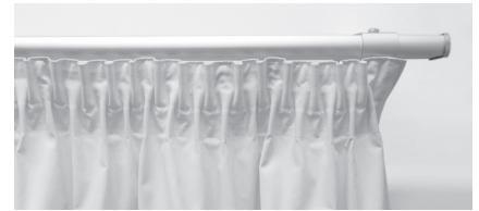
③ フック仕様:ギャザープリーツ