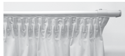
③ フック仕様:ギャザープリーツ