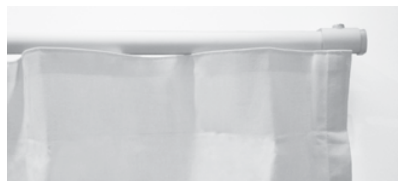
② フック仕様:ノンプリーツ