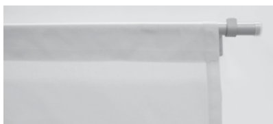
④ ポール仕様:ノンプリーツ