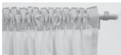
⑤ ポール仕様:ギャザープリーツ