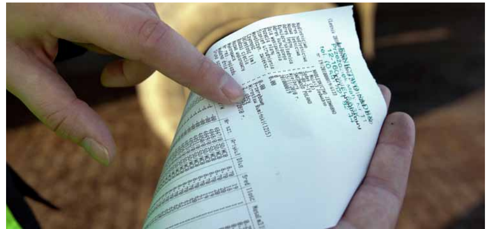
„Minden sofőr egy blokkhoz hasonló listával érkezik. A listán megszámozva szerepel az összes fa, így pontosan tudom, honnan érkezik a szállítmány. Ha akarom, csak beülök az autómba és megnézem, hol állt nemrég még a fa.”