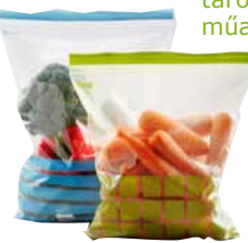
ISTAD műanyag zacskó 995,-/30 db

Az ételeket és a maradókat is tárolhatod többször használható műanyag tasakokban.