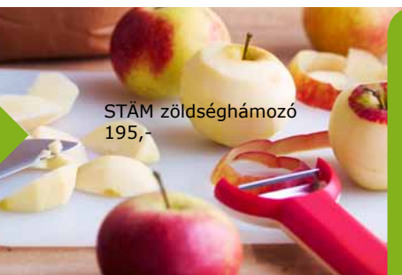
STÅM zöldséghámozó 195,-

TUDDTAD? A nem szezonális gyümölcsök légi úton történő szállítása 10–20-szor nagyobb olajfogyasztást jelent annál, mintha természetes szezonjuk alatt helyben szerezned be őket. Ez további üvegházhatást okozó gázkibocsátást is jelent. Vásárolj szezonális termékeket. Olcsóbbak és finomabbak. Tiszteld a szezonaritást, és így a környezetre gyakorolt káros hatásokat is csökkented.