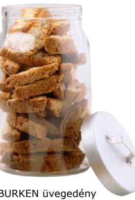
BURKEN üvegedény tetővel 695,-

UTZ: maja nyelven „jó”-t jelent. Az IKEA áruházakban kizárólag UTZ minősített kávé árulunk és szolgálunk fel. Az UTZ Certified egy független, nonprofit szervezet, mely szociális és környezetvédelmi szabványokat állapít meg a fenntartható kávétermesztés és -forgalmazás előmozdítása érdekében. Biztos lehetsz abban, hogy felelősen termesztett kávéét iszol, melynek beszerzése is az előírt módon történt, miközben az ültetvényeken dolgozó emberek is minőségi életet élhetnek, és egy méltányos folyamat részesei.