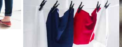
LÖDDER univerzális kendő 795,-

A praktikus mikroszálás törőlkendők saját súlyuk hétszeresének megfelelő vizet is képesek felszívni. A mikroszálás tisztítókendők a zsírral is megbirkóznak, ezért vegyszerek nélkül, vagy kis mennyiségű tisztítószerezettel használhatók. Nem szőszölnek, moshatók és újra felhasználhatók. Válassz ezeket az egyszer használatos papírtörők helyett.