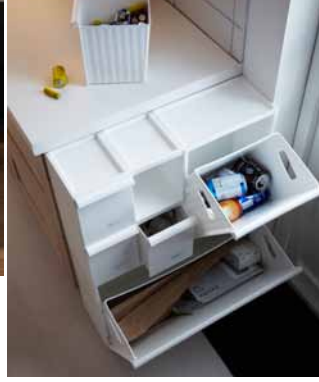
RETUR szelektív hulladékgyűjtők

A hulladékmennyiség csökkentésének egyik módja, ha nem használunk egyfunkciós dolgokat.