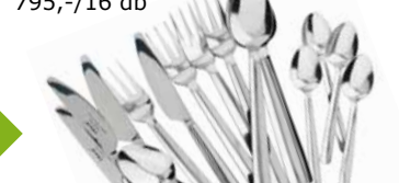
BONUS evőszekőkészlet 795,-/16 db

Habár a hagyományos nejlonzacskókat csak rövid ideig használjuk, lebomlásuk több száz évig is eltarthat. Általában rövid az élettartamuk, és nem túl szépek. Jobb, ha olyan táskákat választasz, melyek erős és tartós anyagból készültek, ezért több éven keresztül használhatók.