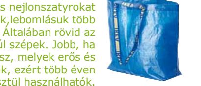
FRAKTA bevásárlótáska 150,-

Saját utunkat járjuk – az IKEA áruházakban többé nem kaphatók egyszer használatos nejlonzacskók. Helyettük kínáljuk a kék FRAKTA bevásárlótáskát, mely rendkívül tartós, és sokféle célra újra és újra felhasználható.