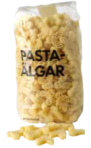
PASTA-ÄLGAR jávorszarvas alakú, teljes kiőrlésű tészta 490,-/500 g

Bioélelmiszer vásárlásával biztos lehetsz benne, hogy a termesztés során semmilyen növényvédő szert vagy műtrágyát nem használtak. A biotermékek rövidebb utat tesznek meg a vásárlóig: a gyümölcsök és a zöldségek frissebbek, és teljesen kifejlett, érett állapotban szüretelik őket, így vásárlásukkal nemcsak az egészségedet véded, hanem a környezetet is!