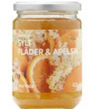
SYLT FLÄDER & APELSIN bodzavirág- és narancslekvár 790,-/450 g