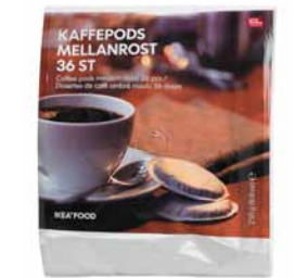
KAFFE PODS MELLANROST kávépárna 690,-/36 db

UTZ: maja nyelven „jó”-t jelent. Az IKEA áruházakban kizárólag UTZ minősített kávé árulunk és szolgálunk fel. Az UTZ Certified egy független, nonprofit szervezet, mely szociális és környezetvédelmi szabványokat állapít meg a fenntartható kávétermesztés és -forgalmazás előmozdítása érdekében. Biztos lehetsz abban, hogy felelősen termesztett kávéét iszol, melynek beszerzése is az előírt módon történt, miközben az ültetvényeken dolgozó emberek is minőségi életet élhetnek, és egy méltányos folyamat részesei.