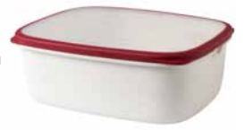
IKEA 365+ ételtároló 695,-

Élelem Az élelmi-szer sokféle szennyezésért felelős. A mezőgazdasági és halászati módszerek, a gyártása során keletkezett szén-dioxid, a szállítás és a keletkező hulladék (az előállításától a csomagolásig) által hatással van az ökológiai rendszerekre.