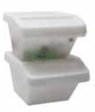
SORTERA szelektív hulladékgyűjtő tetővel 1.990,-

Az újrahasznosítás az otthonodban kezdődik: szelektáld a hulladékot! Könnyebb elkezdeni, ha van olyan hely a konyhában, ahova a szemetet teheted. Csak válaszd ki a neked tetsző, igényeidhez illő tárolóedényeket.