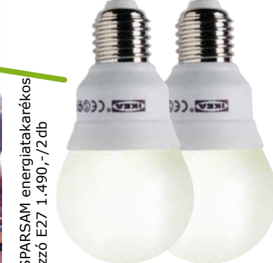
SPARSAM energiatakarékos izzó E27 1.490,-/2 db

Az energiatakarékos izzóknak két előnyük is van: élettartamuk 8–10× hosszabb egy hagyományos izzónál, így a hulladék mennyisége is kisebb, és akár 80%-kal kevesebb energiát fogyasztanak! Remek módja a PÉNZMEGTAKARÍTÁSNAK! Ezen túlmenően a SPARSAM izzók az előírt 5mg helyett csupán 3mg higanyt tartalmaznak.