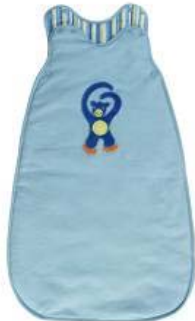
30133409 0-6 mois, turquoise 70130079 0-6 mois, rose