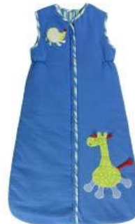
90130078 6 - 18 mois 40133404 6 - 18 mois