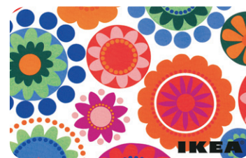
Carte cadeau IKEA

Un crédit vous engage et doit être remboursé, vérifiez vos capacités de remboursement avant de vous engager.