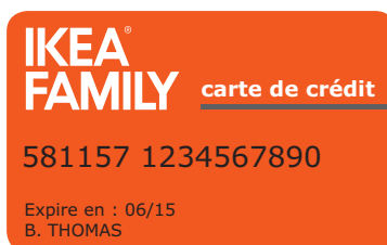
Carte de crédit IKEA FAMILY

Un crédit vous engage et doit être remboursé, vérifiez vos capacités de remboursement avant de vous engager.