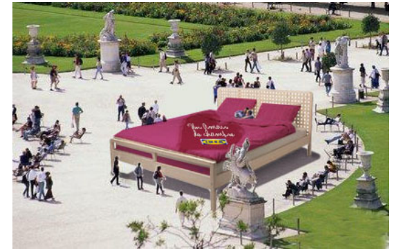
Proposition de mise en scène

Elles coûteront 2€ et les fonds seront reversés à la Fondation Abbé Pierre.