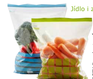
Jídlo i zbytky můžete uchovávat také v igelitových sáčcích na více použití.