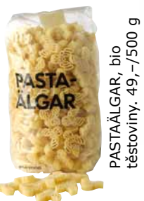
PASTAALGAR, bio těstoviny. 49,-/500 g

Když si koupíte biopotraviny, máte jistotu, že neobsahují žádné pesticidy nebo umělá hnojiva. Bioprodukty se dovážejí z menší dálky: ovoce a zelenina jsou čerstvější a sklízí se je už zralé. To prospívá vašemu zdraví i životnímu prostředí.