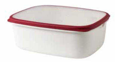
IKEA 365+, dóza na potraviny s mřížkou na dně. 69,-