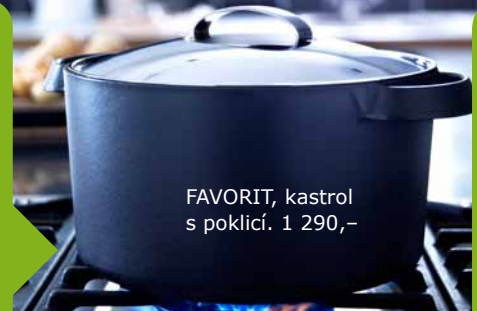
FAVORIT, kastrol s poklicí, 1 290,-

A TOHLE JSTE VĚDĚLI? Poklice zabraňují tepelným ztrátám, takže je dobré je při vaření vody nebo jídla používat. Ušetříte tím asi 20–30 % energie a navíc můžete podávat večeři o něco dřív.