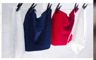
LÖDDER, víceúčelová utěrka z mikrovláčna. 49,-/4 ks

Víceúčelové utěrky z mikrovláčna dovedou vstřebat až sedmkrát víc vody, než samy váží. Absorbují mastnotu, takže je můžete používat bez jakýchkoli chemikálií nebo jen s minimálním množstvím čisticích prostředků. Nepouštějí chloupky, dají se prát v pračce a používat opakovaně. Proto jim dejte přednost před jednorázovými papírovými utěrkami.