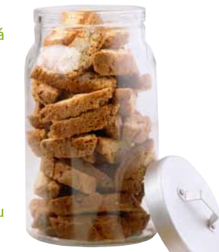
BURKEN, dóza s víčkem. 99,-

Když uvaříte jídla právě tak akorát, nebudete ho muset vyhazovat. Ve víčku dózy RARITET najdete odměrný pohárek, díky němuž množství lépe odhadnete.