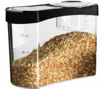
RARITET, dóza s víčkem. 99,-

Když uvaříte jídla právě tak akorát, nebudete ho muset vyhazovat. Ve víčku dózy RARITET najdete odměrný pohárek, díky němuž množství lépe odhadnete.