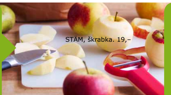
STÅM, škrabka. 19,-