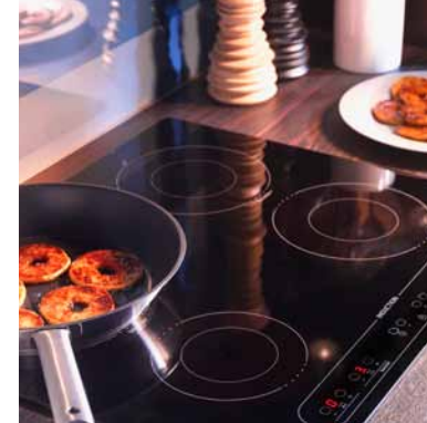
NUTID HIN4T, indukční varná deska, 8 490,-

Teplota z trouby způsobuje, že chladnička a mraznička produkují více chladu. Abyste tomu předešli, nemějte spotřebiče produkující teplo a chlad umístěné vedle sebe, ale oddělte je například skříňkou.