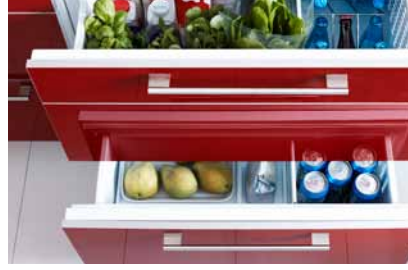
FROSTIG SC155, chladnička se 2 zásuvkami, 16 990,-

Voda Voda je stále drahocennější, proto jí šetřete, kde můžete. V kuchyni spotřebujeme spoustu vody. Naštěstí stačí i maličké úpravy, a spotřeba vody se výrazně sníží. Ušetříte tak peníze i naši planetu!