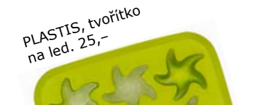
PLASTIS, tvorítko na led, 25,-