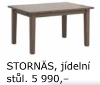
STORNÄS, jídelní stůl, 5 990,-

Krásné stoly STORNÄS a NORDEN jsou vyrobeny z odřezků, které by se jinak vyhodily.