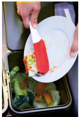
ENVIS, stěrky, 149,-/2 ks

Neplýtvajte vodou na oplachování špinavých talířů, než je dáte do myčky! Mnohem lepší je zbytky odstranit stěrkou.