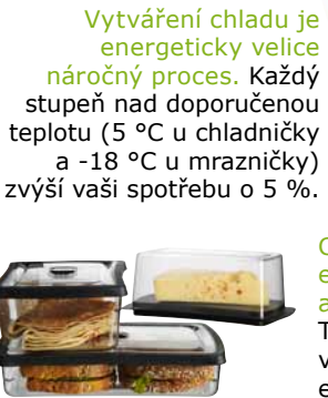
RARITET, série dóz na potraviny.

Vytváření chladu je energeticky velice náročný proces. Každý stupeň nad doporučenou teplotu (5 °C u chladničky a -18 °C u mrazničky) zvýší vaši spotřebu o 5 %.