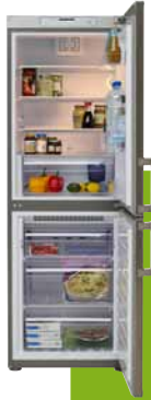
NUTID FCF191/100, chladnička/mraznička s funkcí No frost, 17 990,-

Jak mohou ušetřit energii v kuchyni? Vyberte si spotřebič energetické třídy A nebo A+, ty spotřebovávají méně energie. Spotřebič energetické třídy A například spotřebuje třikrát méně energie než spotřebič třídy C. Spotřebiče z IKEA jsou dobré pro životní prostředí i pro vaši peněženku.