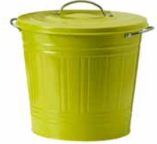
KNODD, koš s víkem. 299,-

Nezapomínejte na kompost! Co takhle využít organický odpad tak, abyste měli vlastní hnojivo na květiny? Bydlíte ve městě? Pořídte si na balkon kompostér!