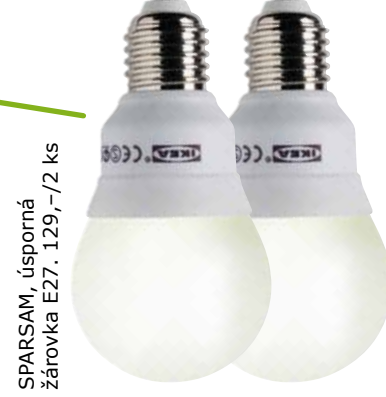
SPARSAM, úsporná žárovka E27, 129,-/2 ks

Úsporné žárovky mají dvě výhody: vydrží 8 až 10krát déle než obyčejné žárovky, takže i množství odpadu je menší. Kromě toho ještě spotřebovávají až o 80 % energie méně. Je to tedy skvělý způsob, jak UŠETŘIT! Žárovky SPARSAM navíc obsahují méně rtuti, než je předepsaný limit, tedy 3 mg místo 5 mg.