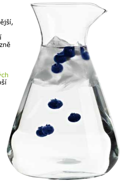
LEENDE, karafa, 149,-

Ze studie univerzity v Bonnu vyplývá, že spotřeba vody lze snížit o 85 % a spotřebu energie o 58%, když používáte myčku nádobí z nabídky IKEA. Díky našim myčkám se emise CO 2 sníží o 150 kg ročně.