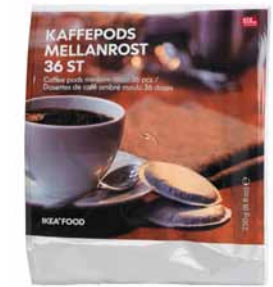
KAFFE PODS MELLANROST, kávové tablety. 79,-/36 ks

UTZ = v jazyce Mayů to znamená „dobrý“ V IKEA prodáváme a podáváme jen kávu s certifikátem UTZ. Je to osvědčení od nezávislé neziskové organizace, jež určuje sociální a ekologické normy pro trvale udržitelné pěstování a distribuci kávy. U nás tak máte jistotu, že pijete kávu ze zodpovědných zdrojů zakoupenou podle pravidel fair trade a že lidé, kteří pracují na kávových plantážích, mají dobré pracovní a životní podmínky.