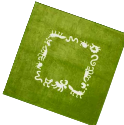
Koberec děti při hraní na podlaze zahřeje. BARNSLIG RINGDANS, koberec. 998,-

SAGOSTEN, nehořlavý dětský polštář na podlahu, má nafukovací výplň z polyolefinu – což je hladký a odolný plast bez obsahu chlóru a dalších škodlivých látek, které jsou součástí častěji používaného PVC. SAGOSTEN, nafukovací výplň s potahem. 699,-