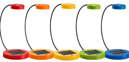
SUNNAN, stolní lampa. 399,-/ks Kombinuje úspornou technologii LED se solárními panely. Lampa SUNNAN nepotřebuje přívod elektřiny, můžete ji používat úplně kdekoli. Stačí nabít solární panel 9–12 hodin na slunci a lampa vám bude 4 hodiny svítit!