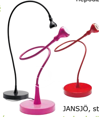
JANSJÖ, stolní lampa. 249,-/ks Využívá technologii LED. Má nastavitelné rameno pro snadné nasměrování světla.

TÄNDA, časový spínač. 99,-/2 ks Časový spínač TÄNDA vám pomůže odpojit přístroje od přívodu elektřiny v době, kdy je nepoužíváte. Ušetříte tak až 10 % energie. Další možností je přístroje důsledně vypínat.