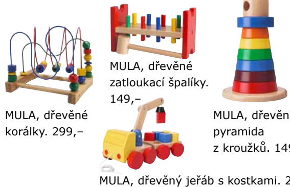
MULA, dřevěné korálky. 299,-

Masivní dřevo, bezpečné barvy, odolná kvalita. Série hraček MULA se vyrábí ze 100% obnovitelného a recyklovatelného masivního dřeva. Použité barvy a laky neobsahují žádné toxické látky, jsou bezpečné pro děti i pro životní prostředí. MULA vyhoví požadavkům celých generací tvůrčích dětí. Tak jen si hrajte!