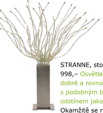
STRANNE, stolní lampa. 998,- Osvětlení LED vydává dobré a rovnoměrné světlo, s podobným barevným odstínem jako běžné žárovky. Okamžitě se rozsvítí naplno a žárovky se nezahřívají. Neobsahuje rtuť.

Příkladem je náš rozrůstající se sortiment osvětlení s technologií LED. LED je zkratka pro světelné diody. Ty způsobily v osvětlení hotovou revoluci, protože technologie LED nejen šetří energii, ale světelné diody zároveň mnohem déle vydrží. Životnost LED je až 25 000 hodin (přibližně 25 let). Spotřebují až o 80 % méně energie než běžné žárovky.