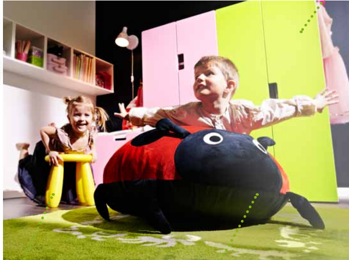
Dětský nábytek MAMMUT je vyrobený z plastu, je velice odolný a snadno se čistí.

Před několika lety jsme dokázali ze dřeva jednoho stromu vyrobit 13 úložných lavic STUVA. Dnes nám jeden strom vystačí na 23 úložných lavic STUVA. Jak jsme to dokázali? Určitý objem dřeva jsme nahradili vzduchem – využili jsme technologii BoS. STUVA, úložná lavice. 1 690,-