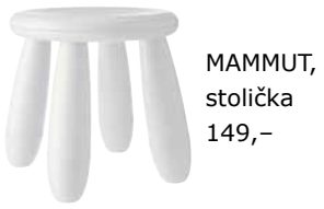
MAMMUT, stolička 149,-

SAGOSTEN, nehořlavý dětský polštář na podlahu, má nafukovací výplň z polyolefinu – což je hladký a odolný plast bez obsahu chlóru a dalších škodlivých látek, které jsou součástí častěji používaného PVC. SAGOSTEN, nafukovací výplň s potahem. 699,-